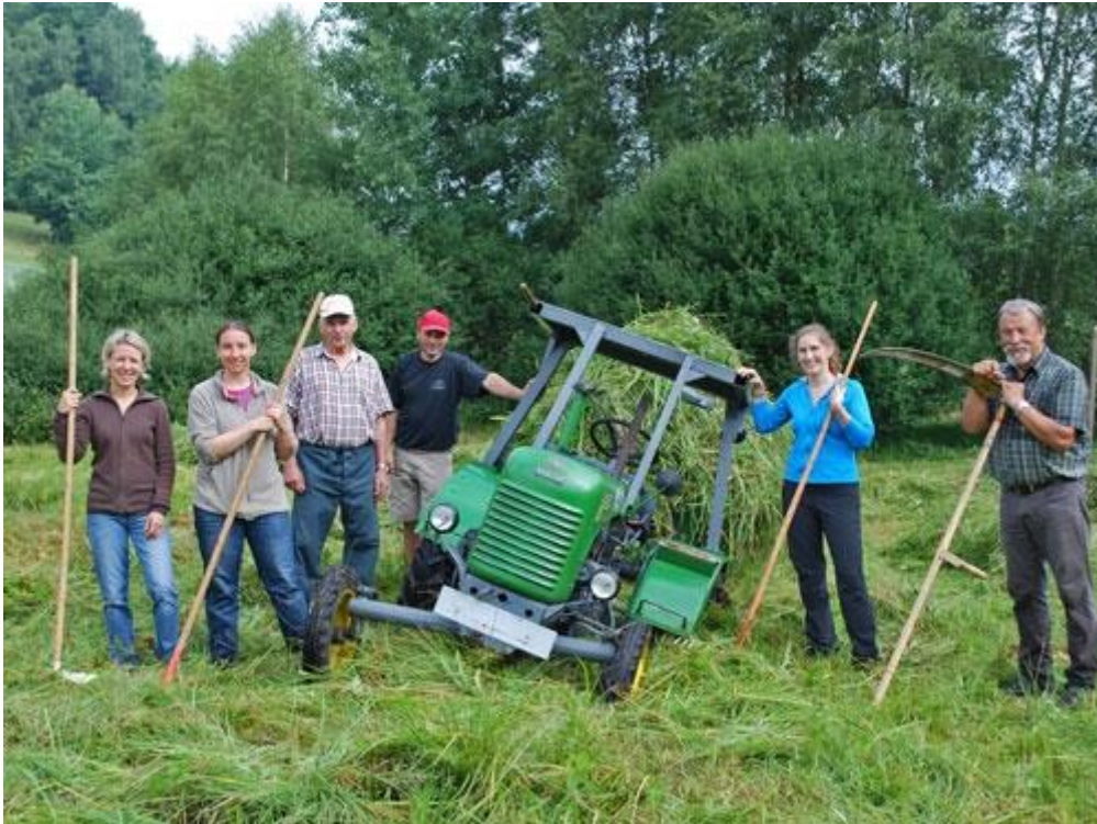
Landschaftspflege mit Hilfe der Bevölkerung, Foto: Naturpark Mühlviertel (zum Download auf Foto klicken, Abdruck mit Quellenangabe honorarfrei)