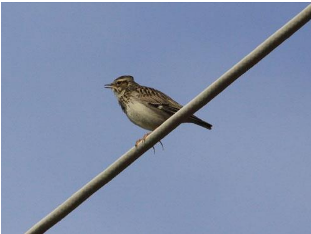
Ein Artenschutzprojekt unterstützt die Heidelerche im Naturpark Mühlviertel, Foto: Hans Uhl (zum Download auf Foto klicken, Abdruck mit Quellenangabe honorarfrei)