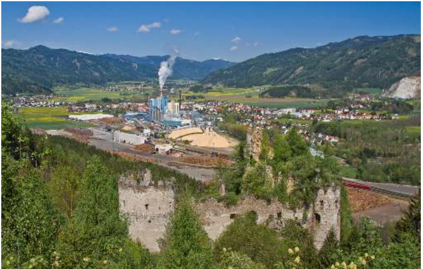
Blick in das Tal von Pöls in Richtung Norden, im Hintergrund der Windpark Oberzeiring und die noch vom Schnee bedeckten Gipfel der Niederen Tauern.