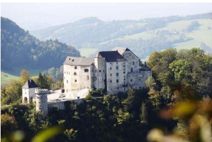
Burg Plankenstein (Copyright: Doris Schwarz König) Autor Unbekannt Quelle Mostviertel Tourismus GmbH