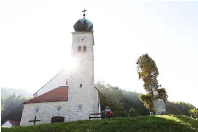
Wallfahrtskirche Maria Schnee (Copyright: schwarz-koenig.at) Autor Unbekannt Quelle Mostviertel Tourismus GmbH