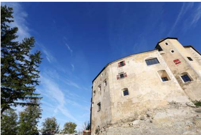
burg Plankenstein