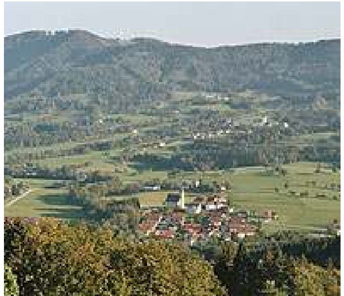
kein text Autor Unbekannt Quelle Mostviertel Tourismus GmbH