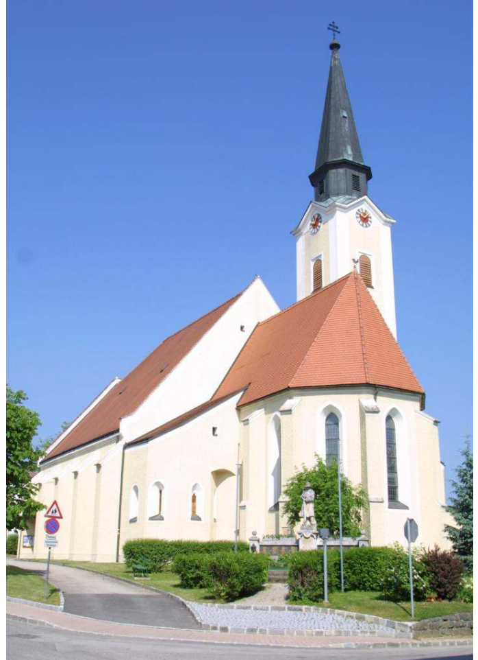
kein text