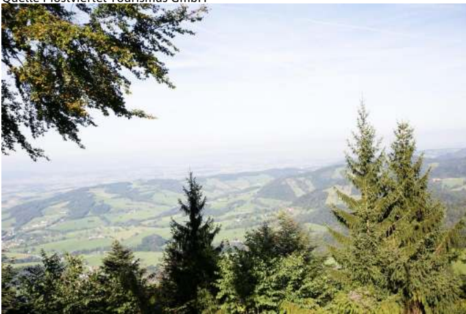
Ausblick Grüntalkogelhütte (Copyright: Doris Schwarz König) Autor Unbekannt Quelle Mostviertel Tourismus GmbH