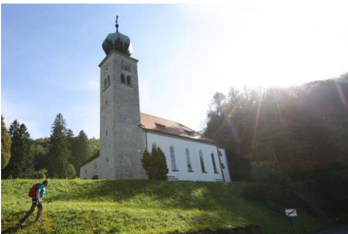
Wallfahrtskirche Maria Schnee