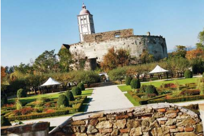
kein text Autor Unbekannt Quelle Mostviertel Tourismus GmbH