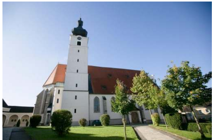
Wallfahrtskirche Mank