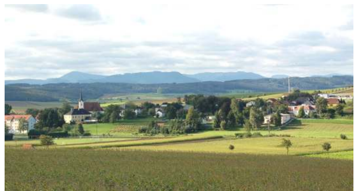
kein text