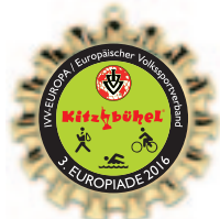
3. Europiademedaille Kitzbühel mit Österreichband