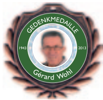
Gérard-WOHL-Gedenkmedaille mit Europaband 1. Präsident IVV-Europa